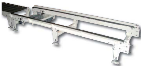
Transporteur Bi-Chaîne TBC