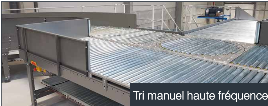
Tri manuel haute fréquence

Nos solutions se constituent d'équipements adaptés aux dimensions de vos produits et liés les uns aux autres par une gestion intelligente et précise. Ainsi, vous pouvez concevoir avec nous votre système de convoyage sur-mesure par rapport à votre besoin.