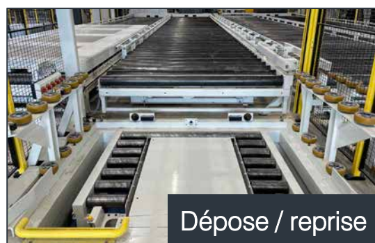
Dépose / reprise