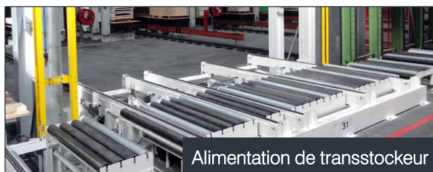
Alimentation de transstockeur