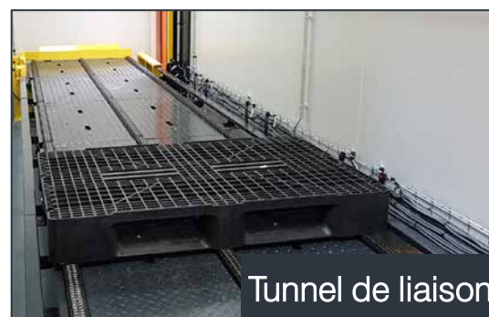
Tunnel de liaison