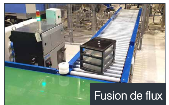
Fusion de flux