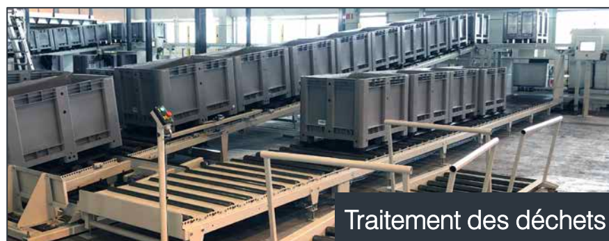
Traitement des déchets

MATREX vous propose de découvrir ses différents équipements pour la manutention des palettes et ainsi concevoir votre système de convoyage sur-mesure à votre besoin. Nos équipements sont conçus pour fournir des années de services fiables à rendement élevé. Ainsi, les entreprises sont en mesure de travailler plus efficacement et économiquement.