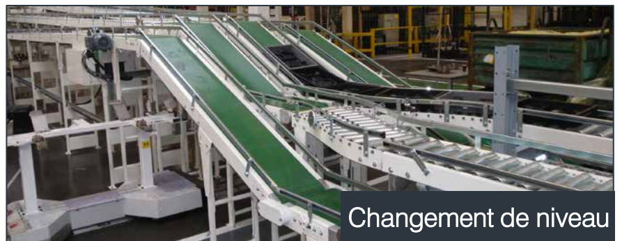
Changement de niveau